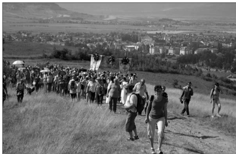
Gyergyói zárándokok. Hazuról haza

Az első alkalommal megszervezett Gyergyószentmiklósiak Világtalálkozója hivatalosan hatvanan regisztráltak, ám valójában ennél lényegesen többen vettek részt az eseményen, hiszen az elmúlt hétvégén a város utcáin folyamatosan egymást üdvözlő régi barátokkal lehetett találkozni. Sőt olyanokkal is, akiknek felmenői régen elhagyták az országot, és mégis otthonuknak tekintik a kis Hargita megyei városkát. A többnapos rendezvény során lapunk azokra a kérdésekre kereste a választ, hogyan látják Gyergyószentmiklóst azok, akik évek óta más országban, más környezetben élnek hétköznapjaikat,