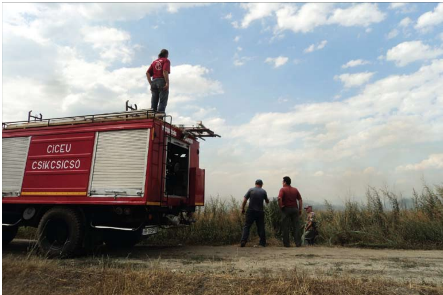
Az égő tőzeggel viaskodó önkéntesek. Évente visszatérő gond