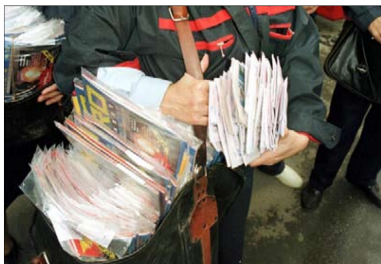
Postástáska. Rejt-e még levelet?

Régmúlt idők helyzetképe ez, melyet így, ebben a formában ma már hiába keresünk. Van, ami eltűnt, van, ami átalakult, és persze jöttek-jönnék be újdonságok is. A postaüzem mint minden információk közmezője és alapja, és mint szerepét a mai napig megőrző óriás intézményhálózat, ma is keresi helyét a napról napra újabb megoldásokat és lehetőségeket termelő információtechnológiai forgószelében. Szakemberek sze-