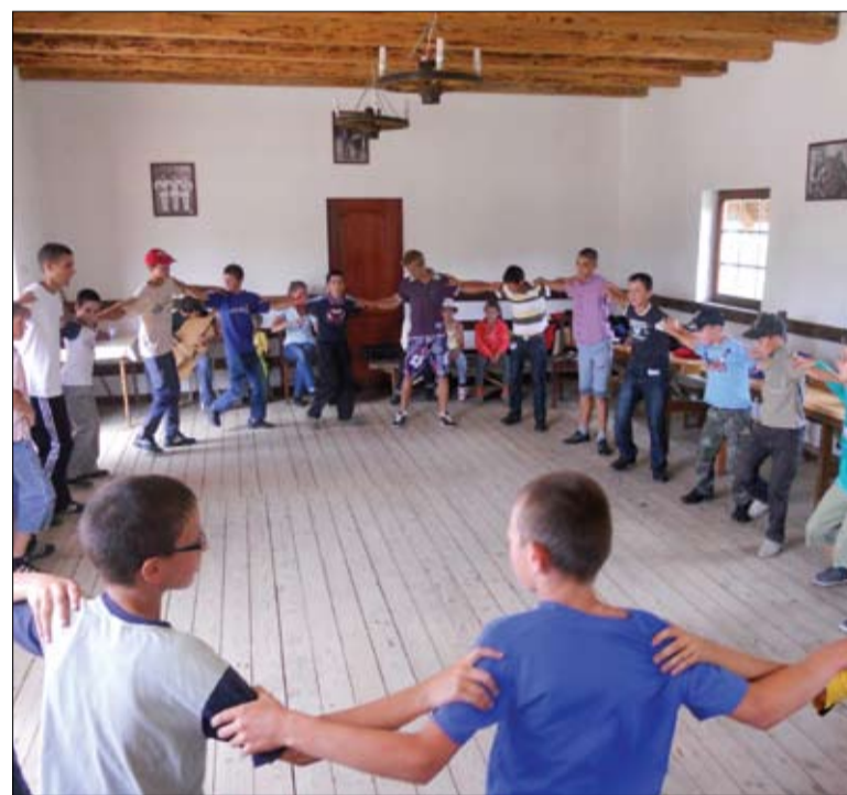
Hejszát tanulnak a gyerekek. Határozott lépések