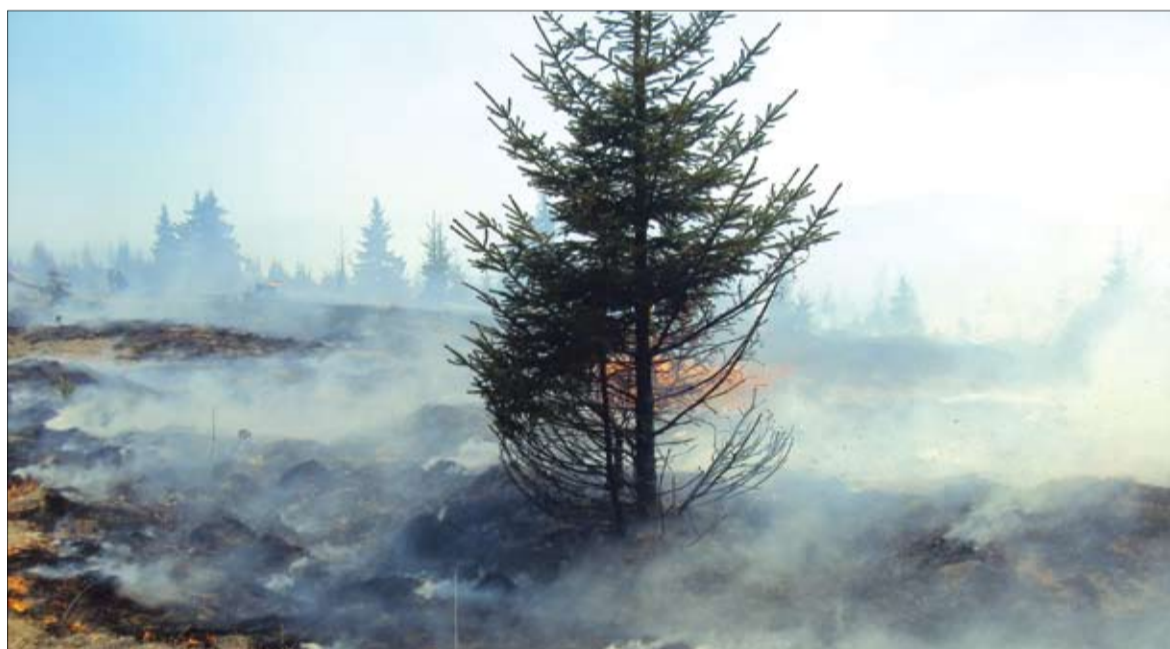
Időnként felcsapnak a lángok. Forró helyzet

Újabb helyszínen csaptak fel a lángok pénteken: ezúttal Somlyó oldalán, négy helyszínen gyúlt meg a növényzet. A gyors beavatkozásnak köszönhetően sikerült hatékonyan és hamar megfékezni a tüzet. A többi tűzeset helyszínén jelenleg is tart a területek fokozott felügyelete annak érdekében, hogy ne csapjanak fel újból a lángok.