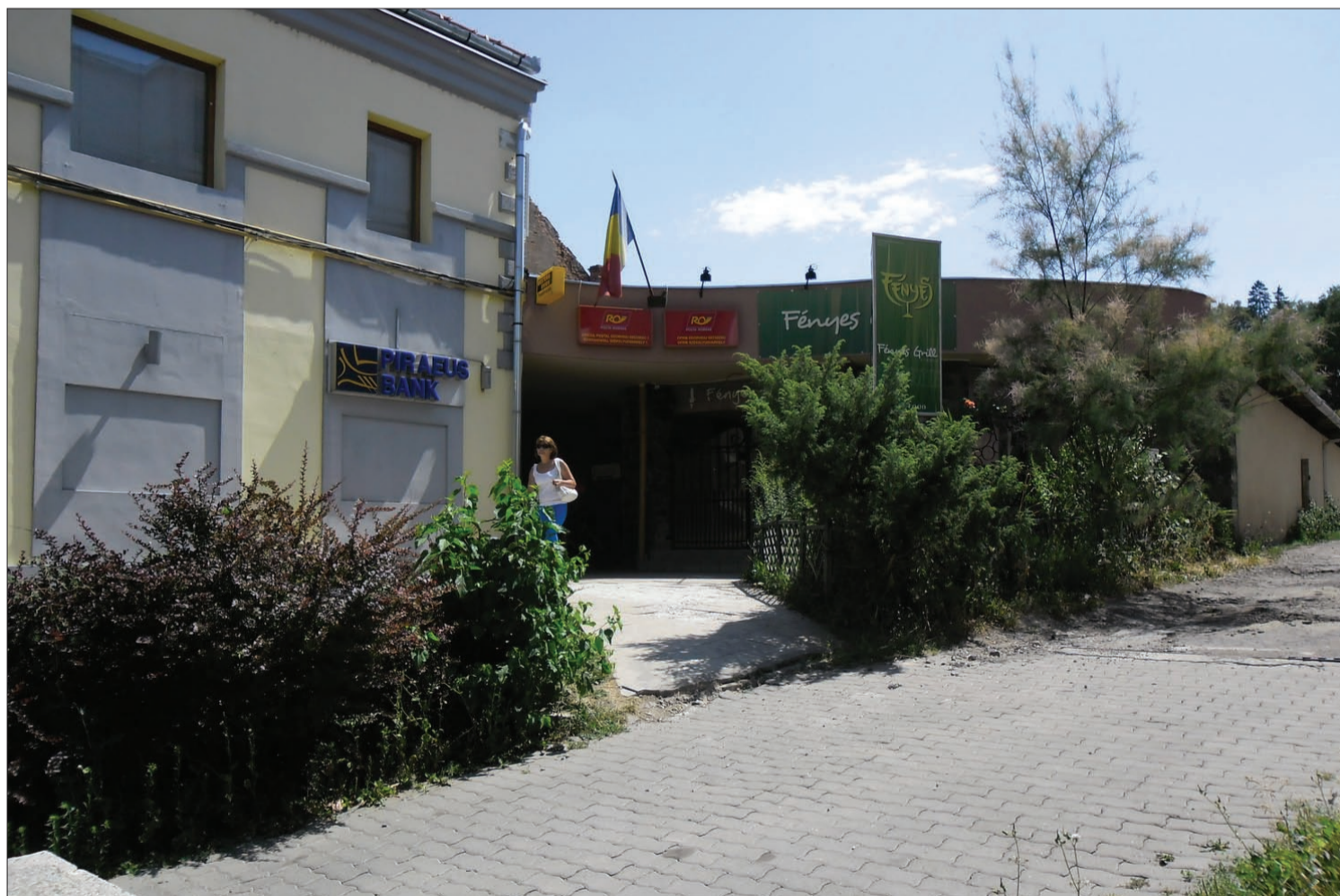
Az írásos információtovábbítás iránti igény, ha csökkenő mértékben is, de még hosszú ideig megmarad. Van és lesz helye a postának

Életednek egy része – ezzel a szlogennel népszerűsíti önmagát, mondhatni találóan a Román Posta. Kérdéses persze, hogy a harmadik évezred információs terében életünknek mekkora részét mondhatja magáénak ez a szerepét mindmáig megőrző, ugyanakkor helyét kereső óriás intézményhálózat. A tökéletes válaszadás igénye nélkül látogattunk el az udvarhelyi postahivatalba. 5. oldal