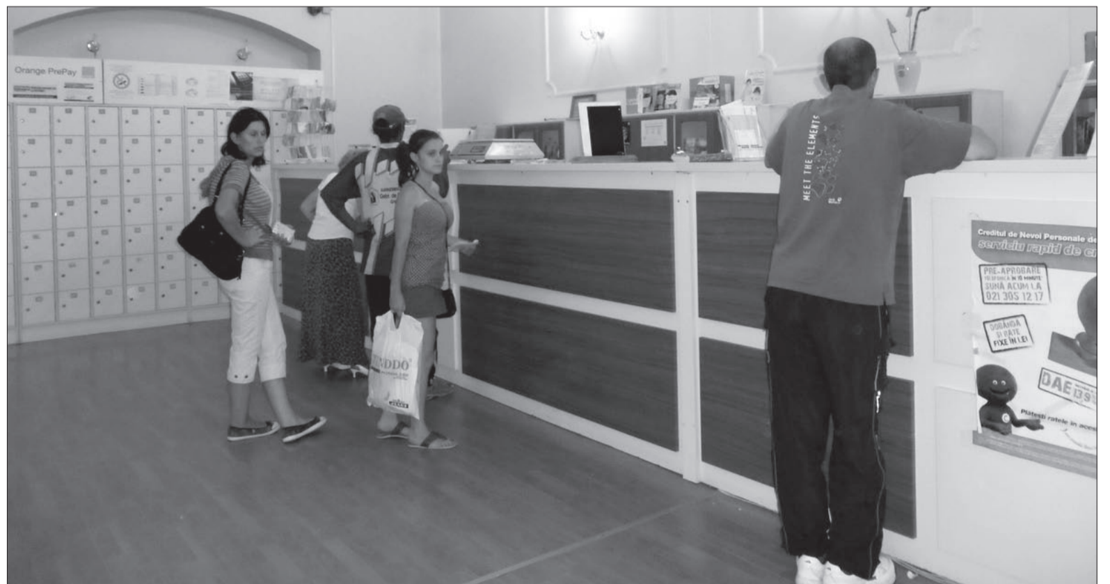
A postaüzem ma is keresi helyét a napról napra újabb megoldásokat és lehetőségeket termelő információs térben

Régmúlt idők helyzetképe ez, melyet így, ebben a formában ma már hiába keresünk. Van, ami eltűnt, van, ami átalakult, és persze jöttek-jönnek be újdonságok is. A postaüzem mint minden információs közmű öse és alapja, és mint szerepét a mai napig megőrző óriás intézményhálózat ma is keresi helyét a napról napra újabb megoldásokat és lehetőségeket termelő információs térben. Szakemberek szerint az írásos információtovábbítás iránti igény, ha csökkenő mértékben is, de még