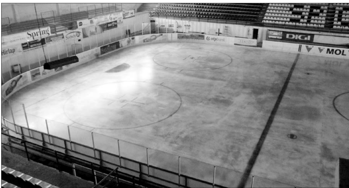
A játéktér megfestését elvégezték. Holnaptól már edzéseket tartanak a műjégpályán