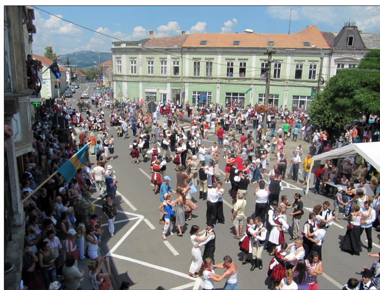
Körültáncolták a város főterét

Noha a kezdés előtt egy órával még úgy tűnhetett a szervezőknek is, hogy meghiúsul a rekordkísérlet, hiszen alig négy százan regisztráltak a reggel óta nyitva tartó szervezősátrakban, a kezdés előtti másfél órában valóságosan özönlöttek a székely ruhások Gyergyószentmiklós főterére.