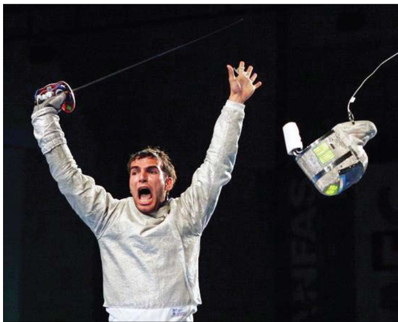
Szilágyi Áron szerezte a magyar küldöttség első aranyát

Ma a női párbajtőr versenyekre kerül sor, ahol három román, Ana Maria Brânză, Simona German és Anca Maroiu, illetve a magyar Szász Emese érdekelt.