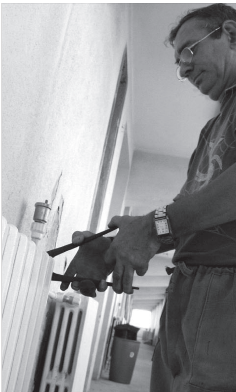
Ez a jövő? Leválás helyett modernizálnák a távfűtést