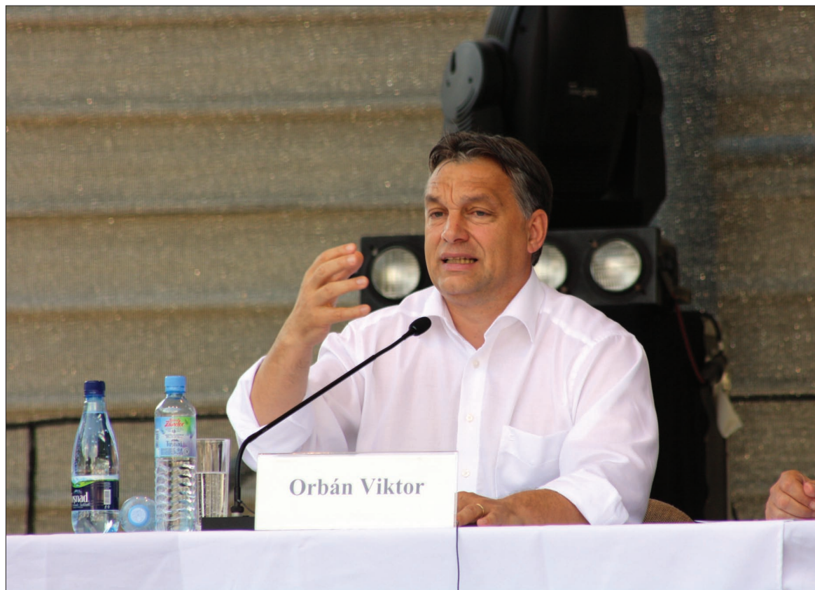
Orbán Viktor: nem várhatunk sikerreceptet a Nyugattól