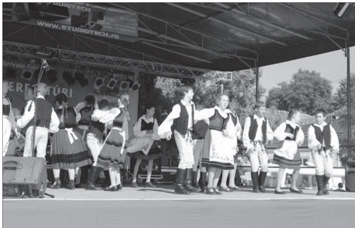
Színvonalas rendezvények várnak a keresztúriakra. Egy hétig ropják

– A csúcs a hét utolsó két napján lesz, pénteken és szombaton, amikor egész napos program várja az érdeklődőket. Itt lesz például az R-Go, mely még nem koncertezett nálunk. Mindenkit szere-