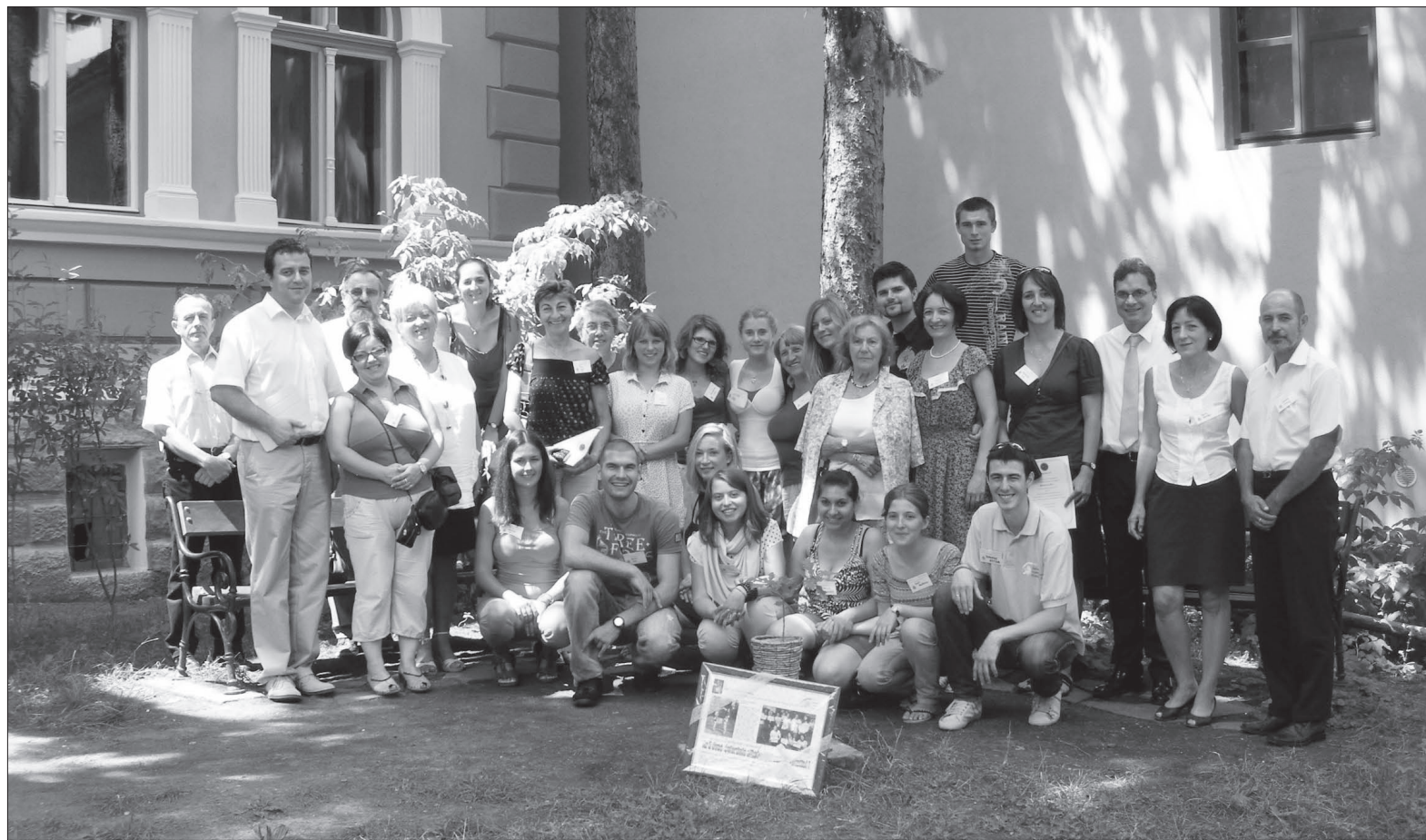
A nagy csapat egy része. Jubileumi ünnepséget tartottak a csereprogram résztvevői és koordinátorai

Mint a péntek délben tartott sajtótájékoztatón elhangzott, a csereprogram a Magyar Máltai Szeretetszolgálat ezen a téren szerzett több tízéves tapasztalata után érkezett – temesvári érintéssel – Székelyudvarhelyre. Célja az erdélyi fiatalok szociális érzékenységének fejlesztése mellett lehetőséget biztosítani arra, hogy megismerkedjenek más népek kultúrájával is. Ugyanakkor, mint Ugron Béla, az alapítvány elnöke hozzátette, a program célja közvetlenül az, hogy a fiatalok az egyéves külföldön való tartózkodás, és az onnan való hazatérés után a megszerzett tapasztalatokat és ismereteket a szülőföldön kamatoztassák.