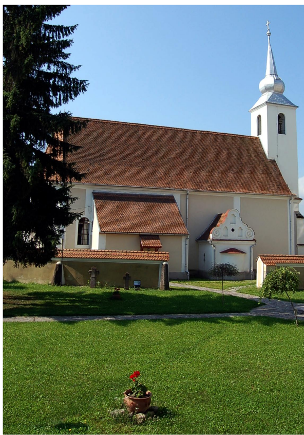
A csíkseredai Szent Kereszt-templom nyári napsütésben

Névvel ellátott fényképeiket és a javasolt képaláírást a benedek.eniko@hargitanepe.ro e-mail címre vagy szerkesztőségünk postai címére (535600 Székelyudvarhely, Kossuth Lajos utca 10. szám) várjuk.