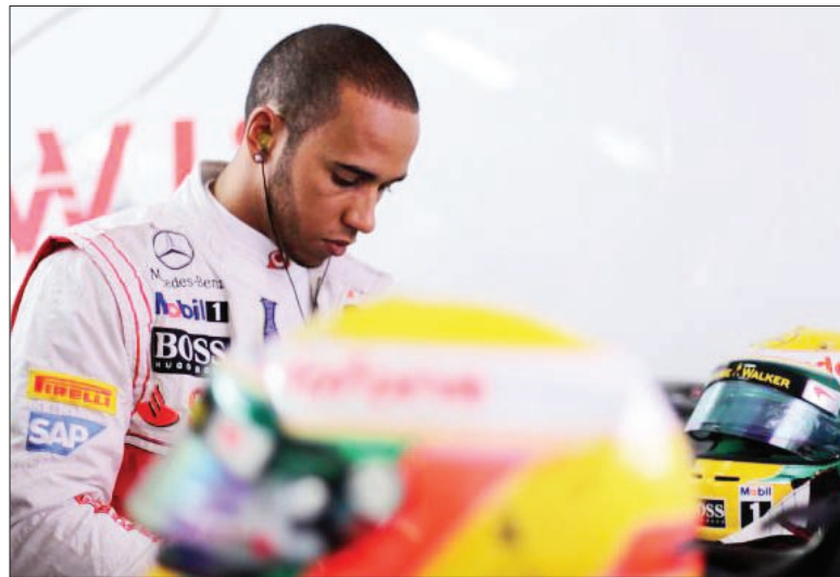
Hamilton rajt-cél győzelmet aratott

Lewis Hamilton, a McLaren brit pilótája nyerte tegnap a 27. Forma-1-es Magyar Nagydíjat a Hungaroringen. A 2008-as világbajnok mögött a Lotus két versenyzője, a finn Kimi Räikkönen és a francia Romain Grosjean végzett a második, illetve a harmadik helyen.