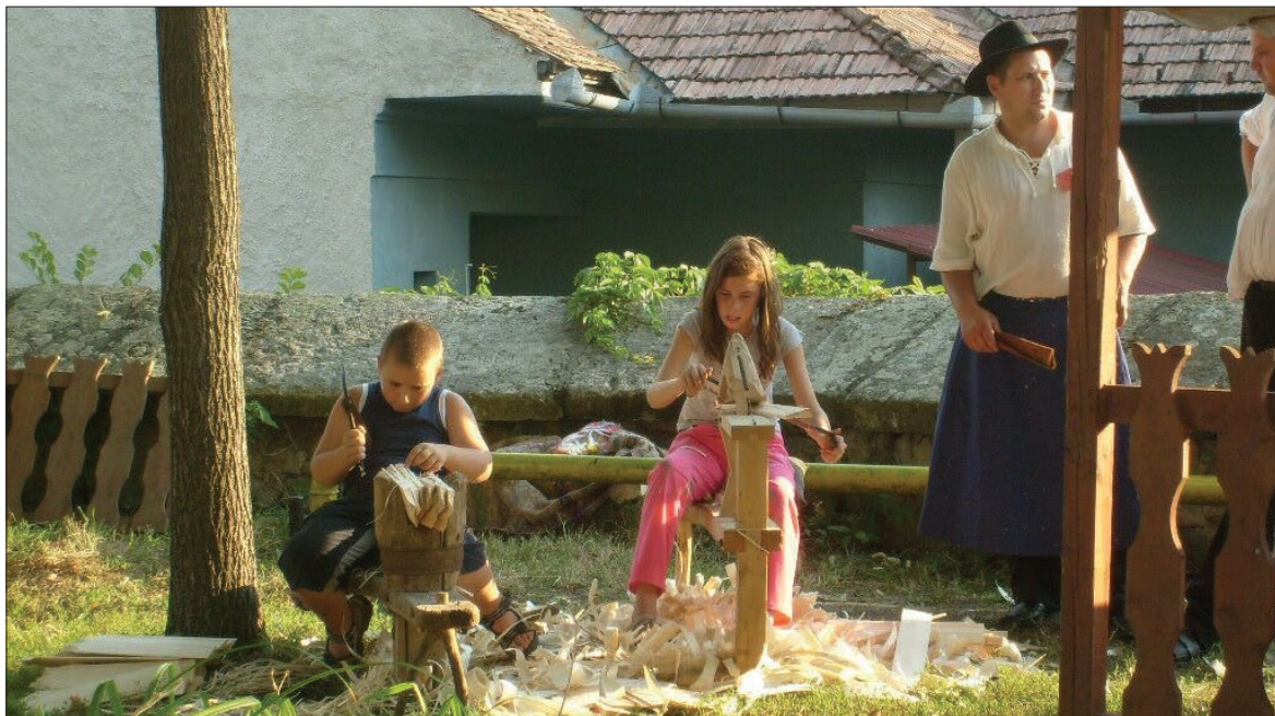
Gyermekek sajátítják el a zsendelykészítés fortélyait. A múltat őrzik