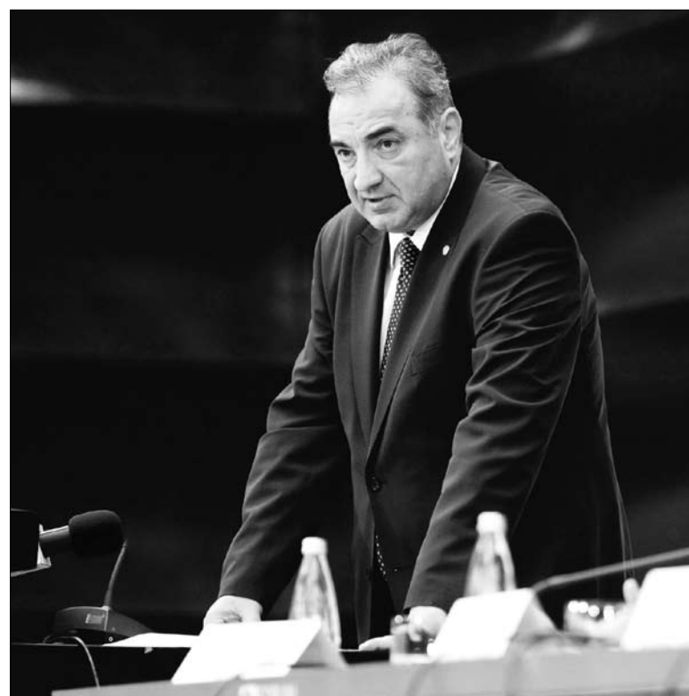
Bizakodó Florin Georgescu pénzügyminiszter. Nem sok oka van rá...

Florin Georgescu kormányfőhelyettes-pénzügyminiszter a múlt szerdai kormányülést követően tartott sajtóértekezletén közölte, hogy a Nemzetközi Valutaalap, az Európai Bizottság és a Világbank képviselői július 31-én érkeznek Bukarestbe, és a velük folytatott tárgyalások augusztus 14-ig tartanak. A látogatás kapcsán utalt arra is, hogy számba veszik majd az előzetes egyezményben kijelölt paraméterek teljesítésének módját, s e tekintetben hangsúlyozta, hogy az általános költségvetés végrehajtása kedvezőnek bizonyult. Hozzáfűzte, hogy a félévi makrogazdasági adatok alapján biztosra vehető az idei 1,5 százalékos gazdasági növekedés. A kormányzati bizakodást, optimizmust azonban sokan nem osztják, s köztük vannak tekintélyes nemzetközi pénzintézetek is.