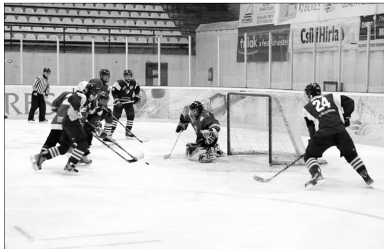
Három csapat kiemelt lesz a magyar bajnokságokon

A kölyök korosztályban 20 csapat indul, és hasonlóan a serdülőkhöz, itt is két azonos létszámú csoportban folyik majd a küzdelem. Am a húsz nevezett csapat közül hét automatikusan (rajlis-tán szereplő létszáma miatt, amely kevesebb, mint a versenykiírásban az A csoport számára meghatározott min. 15+1, vagy játékeréjét tekintve) a B csoportba kerül, a többi tizenhárom csapat pedig kvalifikáció során dönt az A csoport tíz helyéről. Az ISK-HSC