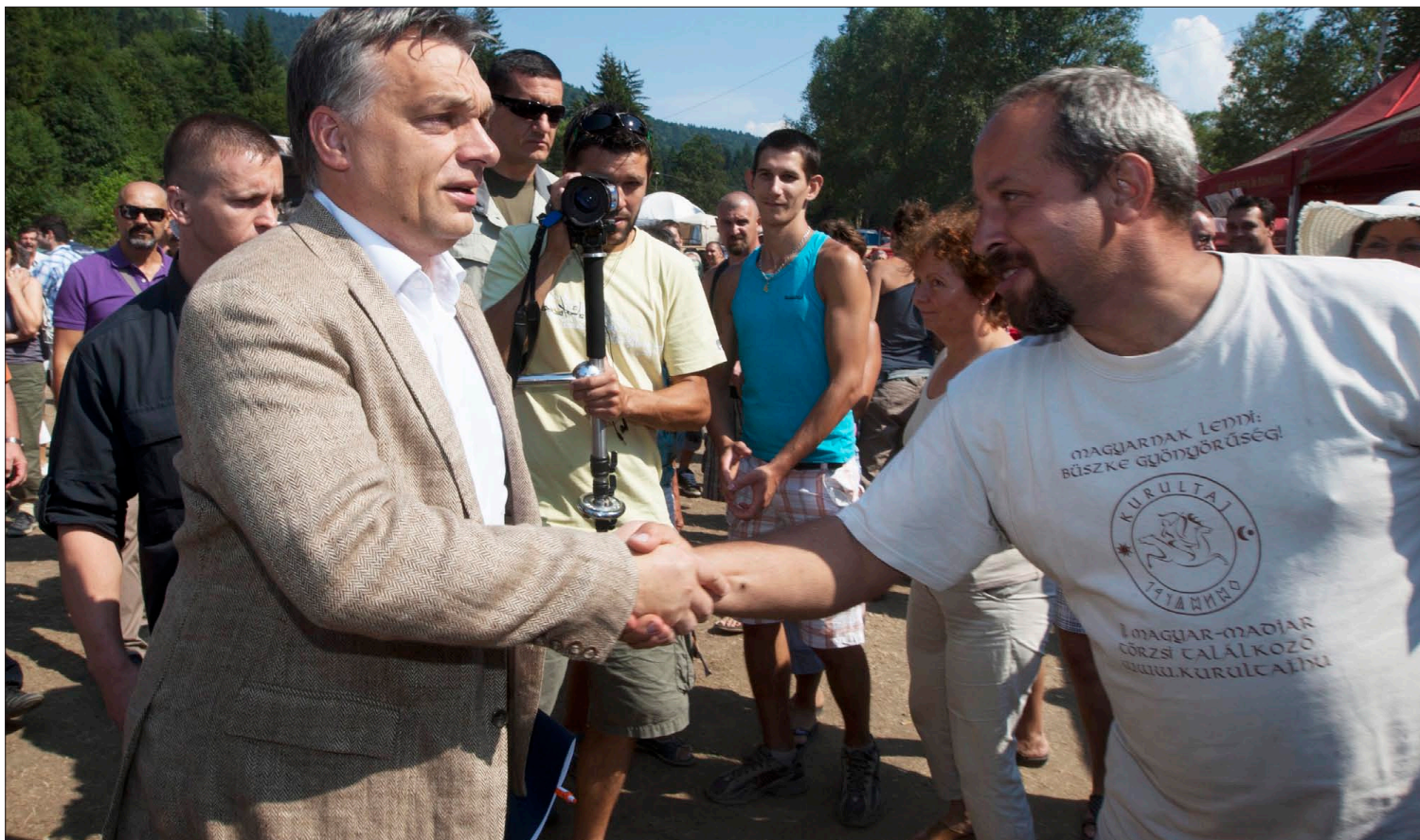
Orbán Viktor Tusnádfürdőn. Feladatának tekinti az egység megteremtését

Orbán Viktor, Magyarország miniszterelnöke idén is részt vett a Bálványosi Nyári Szabadegyetem és Diáktábor zárónapján tartott politikai fórumon. Tőkés László EP-képviselővel, az Erdélyi Magyar Nemzeti Tanács (EMNT) elnökével közösen Magyarország és Közép-Európa megújul címmel értekezett. Az eseményt Németh Zsolt magyar külügyi államtitkár, a diáktábor egyik alapítója moderálta. ■ 5. oldal