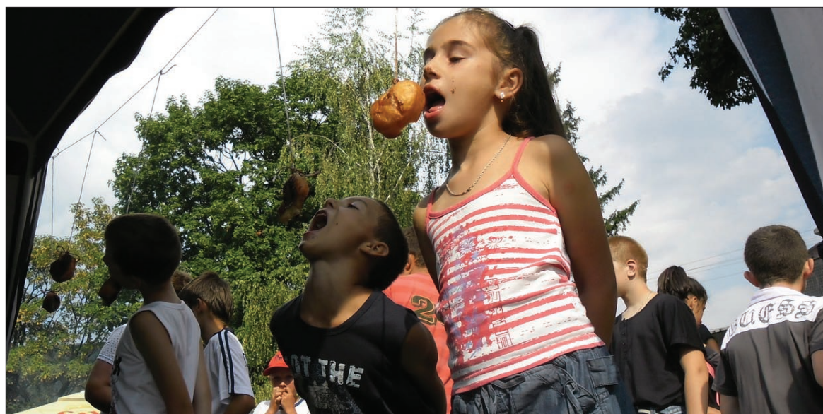
Mézesmadzag. A kicsikre is gondoltak a szervezők

Falunapokat tizenkettedik, a térség fúvózenekariainak találkozáját pedig harmincnegyedik alkalommal rendezték meg szombaton és vasárnap a sóvidéki településen. A fúvósok fesztiválját még a 70-es években a Bucsin-tetőn „Zűg a fenyves” elnevezéssel hívták életre. Ma már fúvóstalálkozóként emlegetik, és nem azért, mert a múlt rendszer öröksége lenne, hanem mert azóta a fesztivál beköltözött Parajd központjába, 2000 óta pedig a falunapok részeként zajlik. Idén a rendezvény plakátján azt is feltüntették,