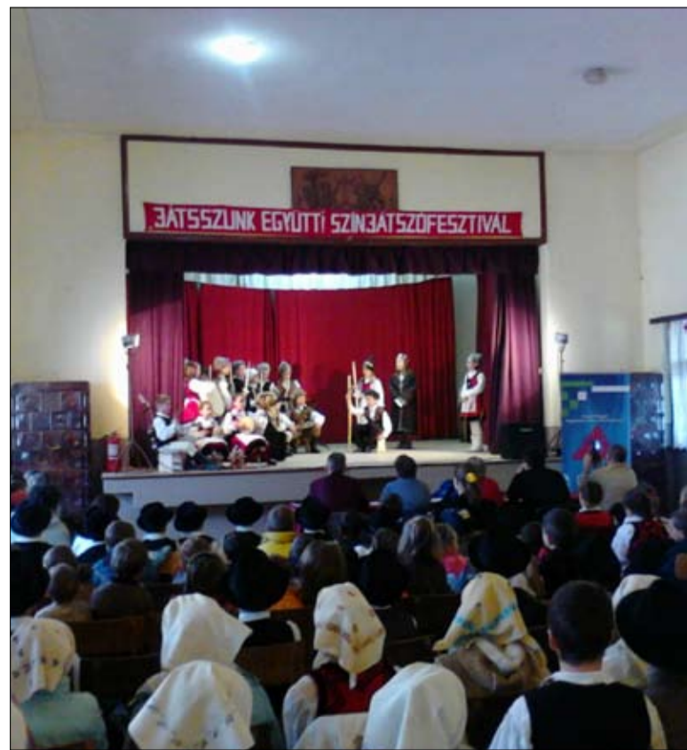
Közel hatszáz gyermek lépett színpadra