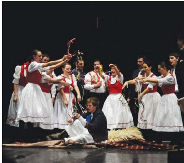
A János Vitéz csíkszeredai bemutatója. Sikeres kitekintés