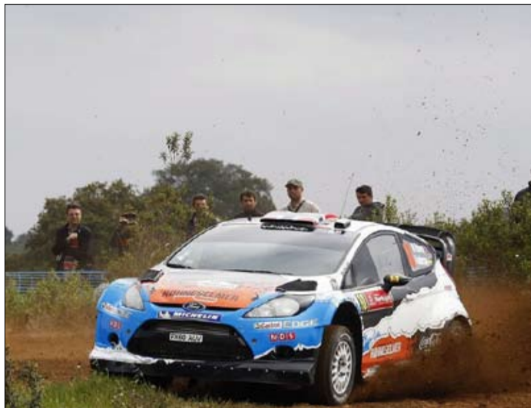
Mads Østberg nyert Portugáliában Hirvonen kizárását követően

Nem ment a gyári csapatoknak a rali-világbajnokság negyedik futama Portugáliában, a murvás borítású pálya több pilótát is megviccelt. Ugyan Mikko Hirvonen megnyerte a viadalt, de a verseny végi ellenőrzésen szabálytalannak találták autóját, és utólag megfosztották az első helytől.