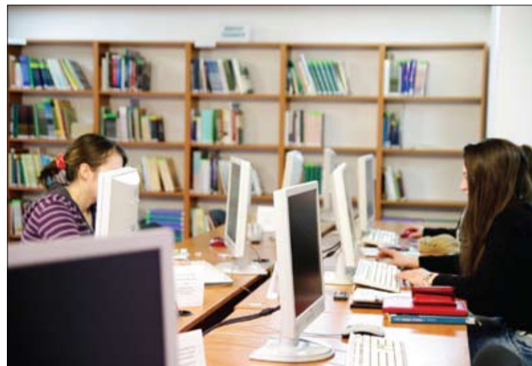
Diákok a Sapientia könyvtárban. Nyílt napokra várják a középiskolásokat

A rendezvénykeretében több száz középiskolás látogatja meg az intézményt. A tapasztalatszerzésre, párbeszédre, foglalkozásokra alapozó