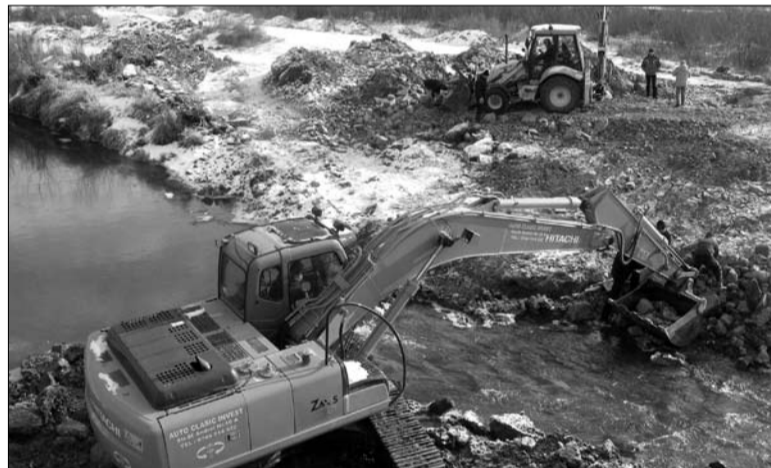
Mederszabályozás Felcsíkon, a Sósárádon. Újra hozzáfognak a munkálatokhoz

– Jelentősebb partvédelmi munkálataink az Olt mentén zajlanak, Nagytusnád és Csíkszentdomokos között. Nagytusnád és Tusnád- és Mitács-patakán folytatódnak az árvízvédelmi munkálatok, Csíkközváson és Csíkmadarason szintén partvédelmi beavatkozás kezdődik a közeljövőben, amely során a patakok medreit szélesítjük ki, és ahol indokolt, támfalakat építünk. Csatószegezen és Csíkverebezen a gátak magasságát növeljük, Madéfalván, Ajnádon, emellett Lővéte és Karácsonyfalva között a Vargyas-patakán lesznek patak-szabályozások. A kivitelezők a következő hetekben kezdenek a munkabázisokra vonulni. A Csíkszentdomokos és Balánbánya közötti Olt-szakaszon már a jövő héten elkezdik a kivitelező az árvízvédelmi munkálatokat. Ezekre a folyó- és patakszabályozásokra azért van szükség, mivel az említett térségekben folyamatosan fennáll az árvízveszély – számolt be lapunknak