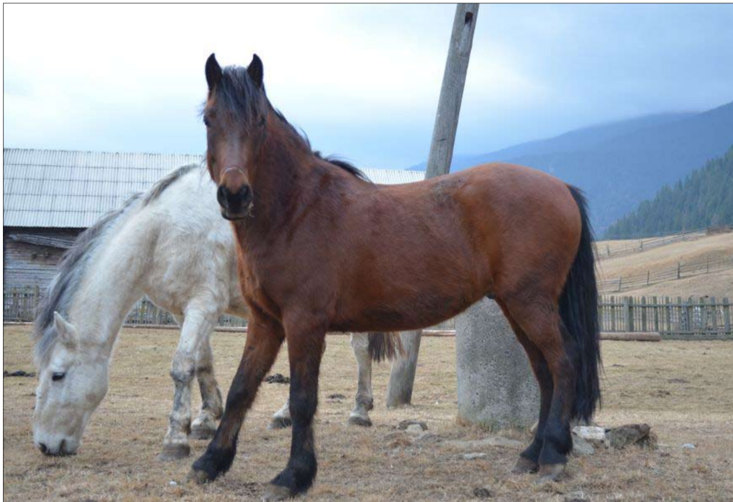
Háromkúti hegyi lovak 2011-ben. A székely ló hasonló fajtajelleget képviselt, de elegánsabb, filigránabb volt, mivel eleink arab telvérekkel frissítették a vérvonalat