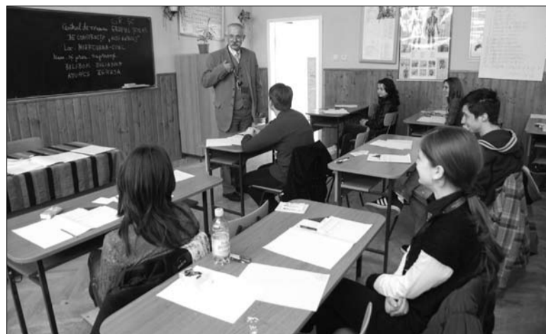
Környezetvédelmi tantárgyverseny a Kós Károly Szakközépiskolában

– Idén az első kiírás során 7 programunkat támogatják, figyelembe véve a kártyahasználók által javasolt megvalósítási sorrendet. A programok között szerepel, hogy tavasz és nyár folyamán megközelítőleg 30 darab „P” alakú kerékpárlezárot helyezünk ki Csíkszereda forgalmasabb pontjain, a Petőfi és Kossuth Lajos utcák, valamint a Temesvári sugárút kerékpárútjai mentén, illetve a városközpontban. Ezekben a lezárokban egyenként 2 kerékpárt lehet elhelyezni. Májusban indul a lakosság és különböző cégek bevonásával a Müller László és a Testvériség sugárút kereszteződésénél található zöldövezet felújítása. A polgármesteri hivatallal partnerségben megvalósuló program során asztalok, padok, szemetek kihelyezését ígérjük, emellett egy kis kerítéssel vesszük körbe a területet. Programjaink között szerepel még a Kossuth Lajos utca zajtérképének elkészítése, 466 csíkyföldi iskolának megközelítőleg 2500 környezetvédelmi kiadványt juttatnánk el, környezetvédelmi szakelőadásokat tartanánk helyi szakemberek bevonásával, melyek később oktatófilm és könyv formában is elérhetőek lesznek, valamint használatruha-begyűjtő pontokat hoznánk létre a Caritas partnereként, akik eljuttatnák a begyűlt ruhákat a rászorulóknak – ismertette a Zöld SzékelyFöld Egyesület elnöke.