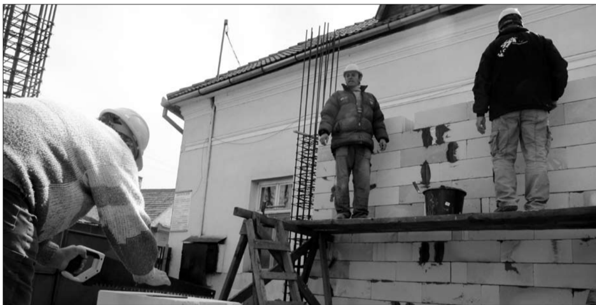
Építőmunkások dolgoznak a Fogarassy Mihály utcai ingatlan átalakításán. Az ápoltak ősszel visszaköltözhetnek

A költözés oka, hogy az uniós normák betartása végett átalakításó-