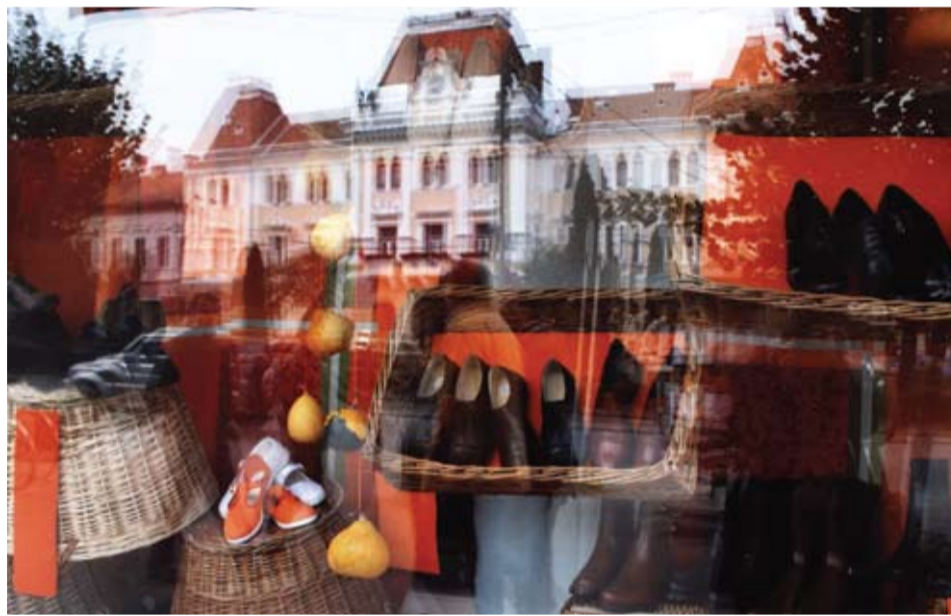
A fotó Fekete Réka Kisváros Őszel című pályázatra beküldött alkotása