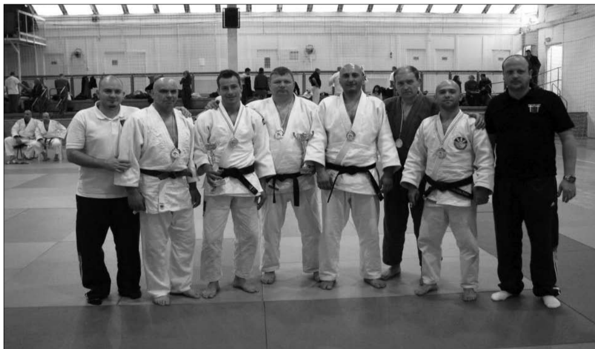
A Csíkszeredai Sportklub veterán cselgáncsozói

Több éremmel a zsebükben tértek haza a Csíkszeredai Sportklub veterán cselgáncsozói a Magyar Nyílt Masters nemzetközi bajnokságról. A veteránok mellett az U11, U13 és az U15-ös korosztály Fogarason küzdött a regionális döntőben.