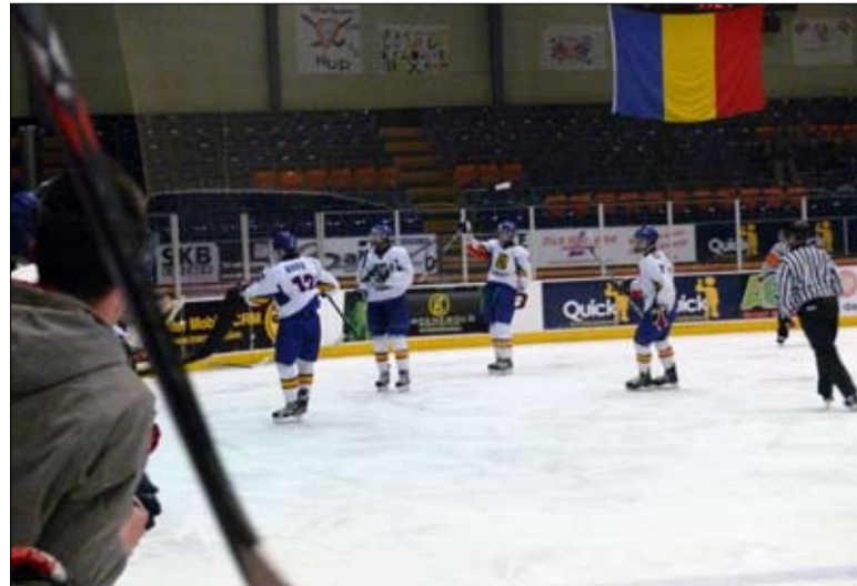
Hildebrand góljának örvend a válogatott csíki sora

A Csíkszeredai ISK-HSC kölyöksapata megszerezte a bronz-