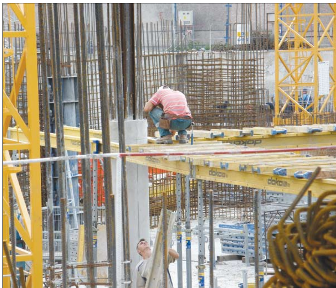
Munkában. Hargita megyében a foglalkoztatottak aránya 63 százalék, a megye lakosainak 49 százaléka áll alkalmazásban

Folytassuk a sort az Országos Adóügynökség elnökének 2012/70-es rendeletével. Ezzel a rendelettel is bizonyos nyilatkozatok kitöltési utasításait módosították, az állami költségvetéssel szembeni fizetési kötelezettségekre vonatkozó nyilatkozatról, a 100-as űrlapról, valamint a nyereségi adóra vonatkozó nyilatkozatról, a 101-es űrlapról van szó. Mindkettő esetében tartalmi vonatkozásban is fellelhetők újdonságok a szóban forgó rendeletben. A 2011-es esztendőre vonatkozó nyereségadó-nyilatkozatot március 26-tal bezárólag kell benyújtani, kivételt képezve azok az adófizetők, amelyek a nyereséget mezőgazdasági tevékenységből realizálják, illetve a gazdasági tevékenységet is folytató egyesületek és alapítványok, melyek esetében a benyújtási határidő február 25.