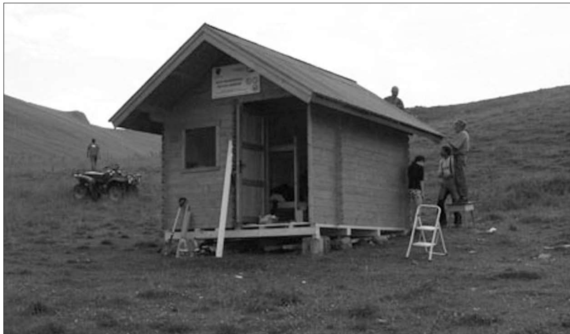
A hegyimentők által felállított menedék. A télen eltévedt turisták utolsó esélye lehet

Három ember életét mentette meg a Hegyimentő Közszolgálat a Nagyhagymás-hegységben felállított hegyi menedék. A megyében jelenleg hét faház nyújt védelmet a szél és hideg ellen a szabad ég alatt rekedt turistáknak, de további négy menedék kihelyezését is tervezik a hegyimentők.