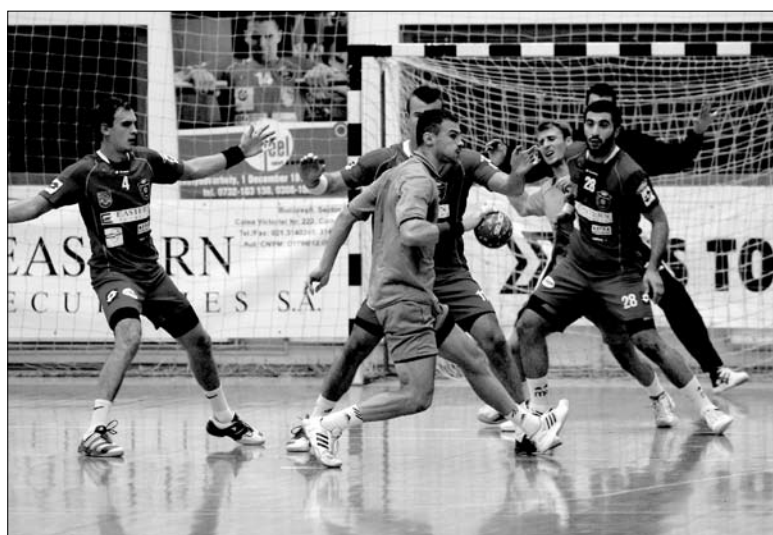
Ezúttal sem okozott gondot az SZKC-nak a Steaua legyőzése