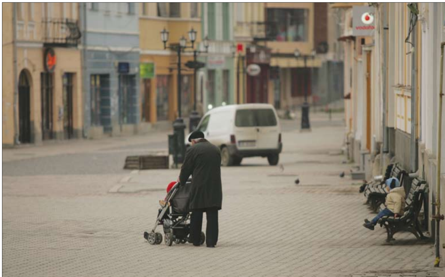
„Generációk sétája” Csíkszereda központjában. A megyeszékhely stabil lakossága jelentősen csökkent, a tendencia általánosnak mondható

Az ország lakossága tíz év alatt 2,6 millió fővel csökkent – derül ki a tavalyi népszámlálás nem végleges adataiból. Jelentős – 13,6 százalékos – a romániai magyar közösség lélekszámának apadása is: a közösség jelenleg 1 238 000 fős, vagyis közel kétszázézerrel kevesebb, mint 2002-ben. Hargita megyében 258 615 személy, az állandó lakosság 84,8 százaléka vallotta magát magyar ajkúnak, számuk ugyan 2002-höz viszonyítva mintegy 18 000-rel csökkent, de a magyarság részaránya a megye stabil összlakosságában növekedett. 6. oldal