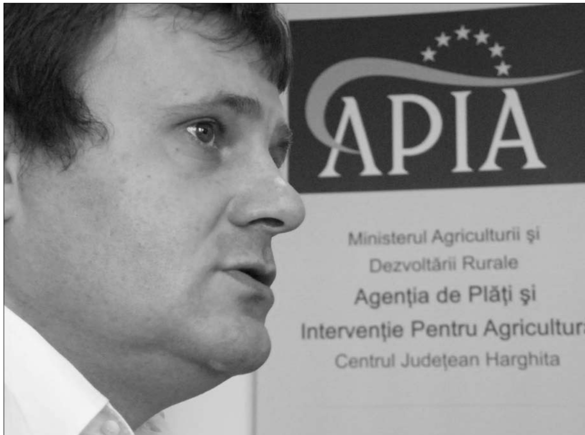
Haschi András Péter: lényeg a támogatási rendszerbe vont területnagyság növelése