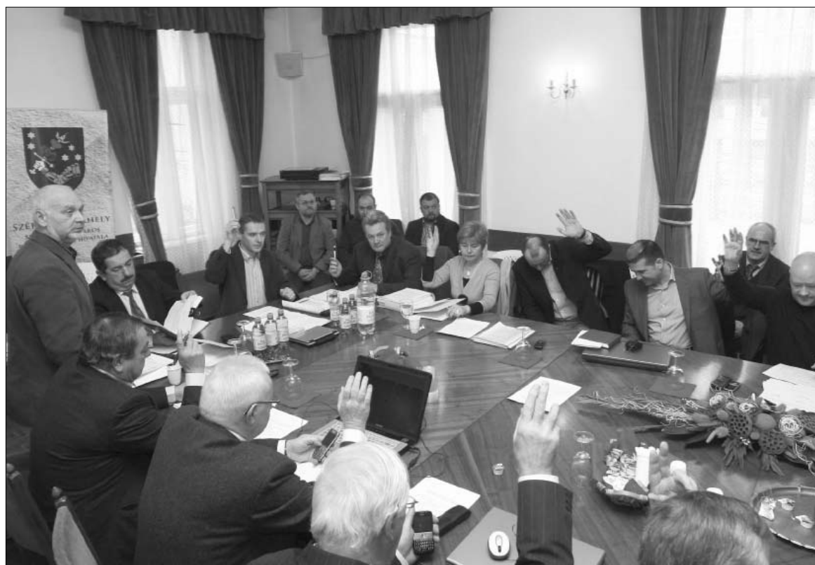
Elfogadták a költségvetést. Rekordidő alatt

Azt is megtudtuk, a 66,854 millió lejt nem kis hányada úgynevezett „átutazó” pénz. Csak a tanügy anyagi és dologi költségekre nem kevesebb mint 26,4 millió lejt kap, melyből 22 millió lejt „átfut” a polgármesteri hivatal számláján. Hasonló a helyzet a polgármesteri hivatalhoz tartozó egészségügyi intézmények számára központilag folyósított összegekkel is. Jelentős viszont a beruházásokra fordítható bü-