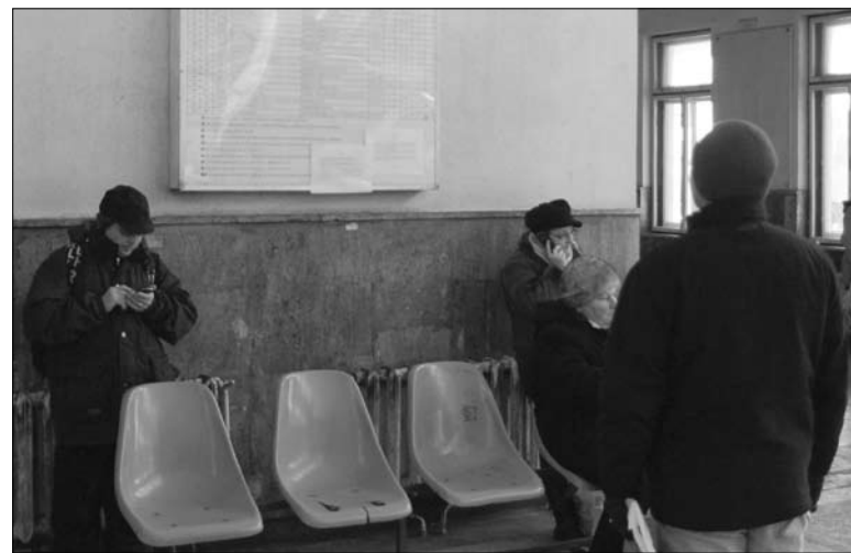
Plakáttal „módosított” menetrend a csíkszeredai állomáson. Változások

A CFR csíkszeredai állomásának vezetősége bizonyos javítási munkálatok idejére – január 23. és március elseje között – módosításokat eszközölt Maroshévíz és Gödemesterháza (Stânceni) közötti személyvonat esetében. Ebben az időszakban munkanapokon a 4503-as személyvonat nem Maroshévíz és Déda között fog közlekedni, hanem Brassó és Maroshévíz között, a 4508-as számú személyvonat sem Déda és Maroshévíz között, hanem Maroshévíz és Brassó között fogja az utasokat szállítani.