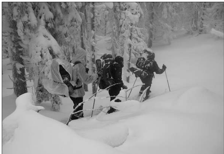
Téli túrázó. Megfelelő előkészületeket igénylő élmény