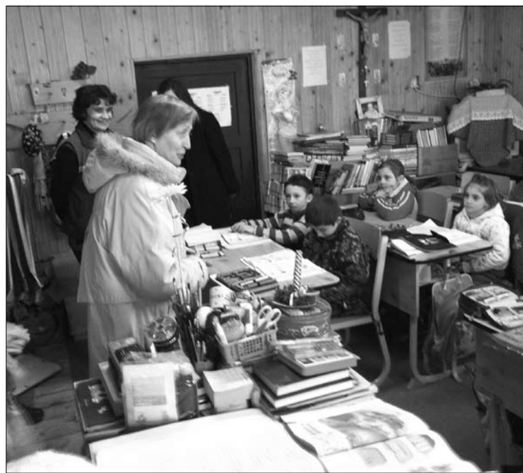
Tanácskozás mellett iskolalátogatás. Hidegben, huzatban tanul a tizennégy gyerek