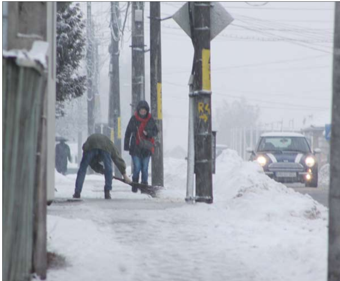
Csíkszeredai utcafé. Járókelőknek, gépkocsival közlekedőknek is kisebb nehézségeket okozott a hétvégi havazás

A havazás megnehezítette a forgalmat a megye útjain, és Csíkszeredában is nehézkesen tudtak közlekedni mind a gyalogosok, mind a gépkocsit vezetőik. A forgalom a szélsőséges időjárási viszonyok miatt nehézkesen ugyan, de viszonylag fennakadásoktól mentesen zajlott, hosszabb ideig tartó útlezárásokra sehol nem kényszerültek az illetékesek. Olvasóink jelezték, több kamion csak igen lassú tempóban és ezért torlódást okozva tudott pénteken délután átkelni a Hargitán. Péntekről szombatra virradó éjszaka egyébként a havazás miatt kamionstopot rendeltek el a 7,5 tonnánál súlyosabb járművek számára a Csíkszeredát Székelyudvarhellyel összekötő 13A jelzésű, illetve a Gyimeseken átvezető 12A jelzésű országúton, de a korlátozást szombatra mindkét esetben feloldották. Cătălin Romanescu megyei ügyi igazgató szerint az intézkedéssel azt akarták megelőzni, hogy az esetleg elakadó tehergépkocsik feltartóztassák a forgalmat.