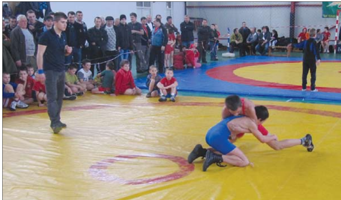
A múlt kötelez. A jelen biztat. A jövő épül