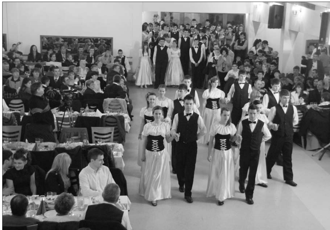
Több mint négyszáz fős vendégsereg koszorújában zajlott a nagykorúsító bál Remetén. Fontos kapocs

Remetei unikumnak számít a Farsangi Nagykorúsító Bált immár negyedik alkalommal szervezte meg az önkormányzat megbízásából az Együtt a Jövőnkért Egyesület. Célja, hogy a novemberi Lénárd-bál után legyen farsangban is alkalom az együttlétre, ám a mulatozásnál többet is