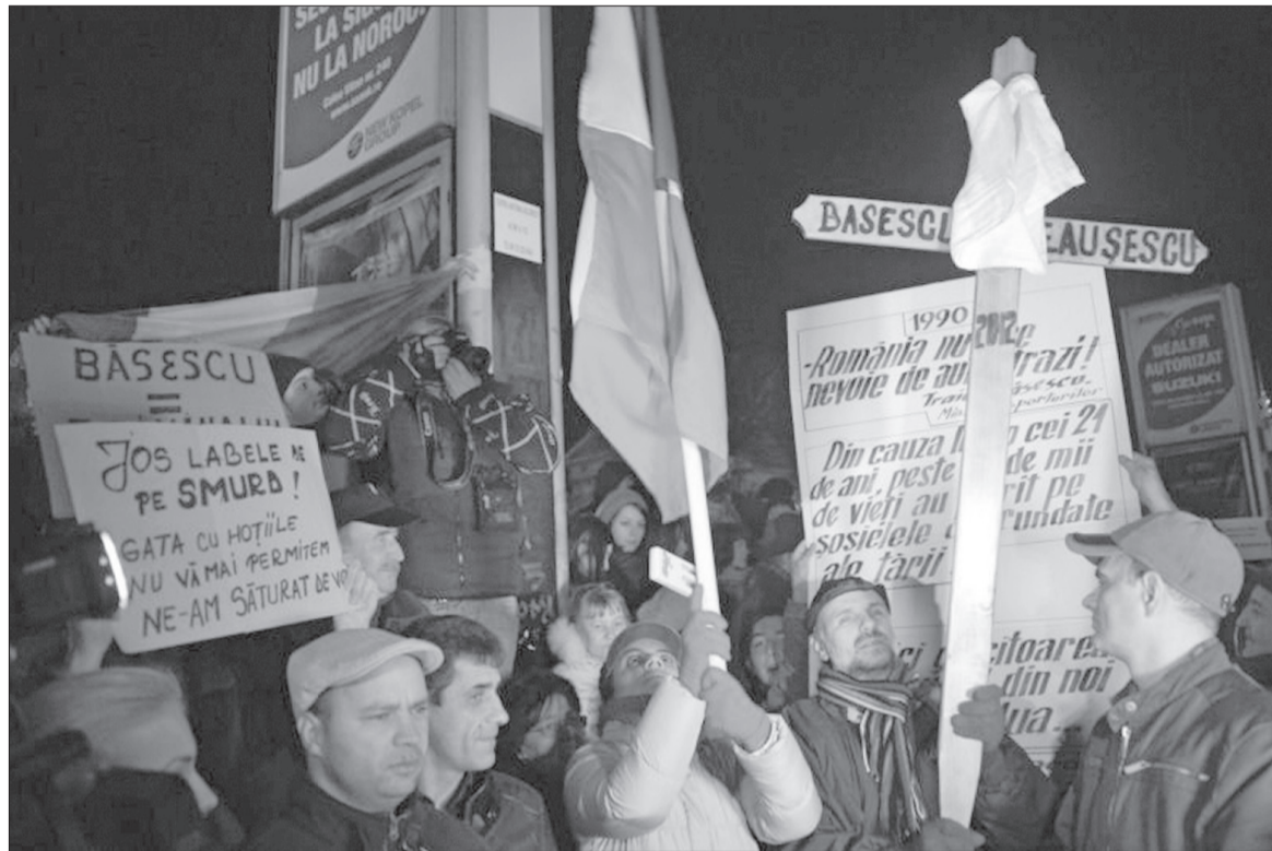
Tüntető tömeg Bukarestben. A Raed Arafattal szimpatizálók megmozdulása államfőellenes demonstrációba ment át

Az Emil Boc miniszterelnöknek címzett kérés váratlan volt, hiszen korábban éppen az államfő volt az, aki decemberben többször állást foglalt a jogszabály társadalmi vitára bocsátása mellett. Băsescu ugyanis az egészségügy privatizációját szorgalmazza, amit a tervezet szabályoz. Az esetleges magánosítás éles vitát váltott ki a hazai közéletben, amely Raed Arafat államtitkár-helyettesi pozíciójából való lemondásával még nagyobb hangsúlyt kapott. Băsescu az elmúlt héten – szintén egy televíziós műsorban – keveredett éles szóváltásba a SMURD mentőszolgálatot kiépítő Arafattal. A Băsescu által támogatott tervezet ugyanis a