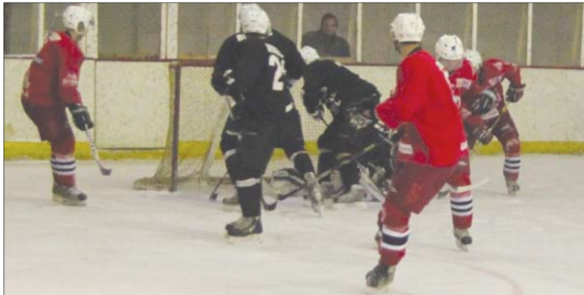
Harcos mérkőzéseken győzte le a Progym a bukaresti diákcsapatot. Az Sportulnak véget ért a bajnokság