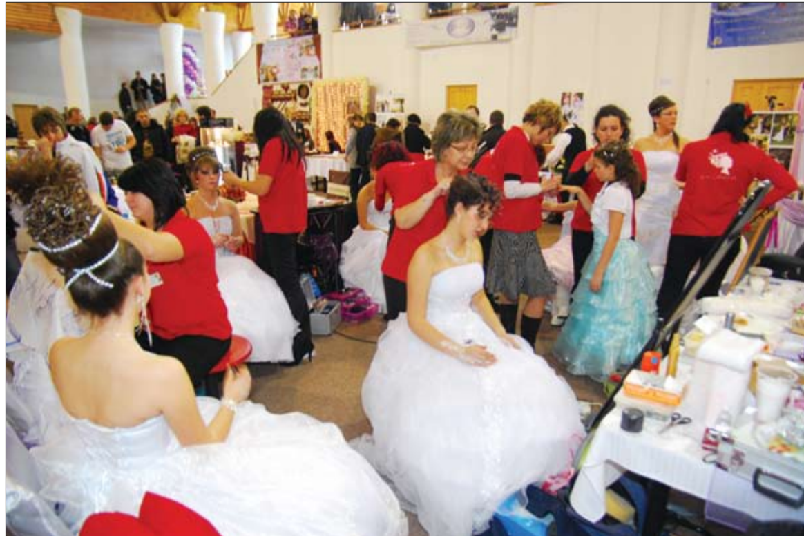
A korábbiánál sikeresebb, gazdagabb és hosszabb kiállítást szerveztek Csíkmindszenten. Középpontban a menyasszony

A csarnokba lépve máris két cukrászda remekeibe, gyönyörűen díszített, egyedien kivitelezett menyasszonyi tortáiba „botlottunk”, és már elsőre feltűnt a szervezés gondossága, hogy minden szolgáltatást több, vagy legalább két cég képvisel. Ez a bő választék egy egészséges versenyhelyzetet biztosít az ugyanolyan szolgáltatásokat nyújtó vállalkozásoknak, és mindemellett a