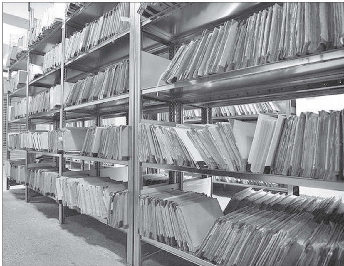
Dokumentumok az országos levéltár polcain. A katolikus püspöki konferencia az egyházi iratok visszaszolgáltatását kéri

mokrata Liberális Párt (PD-L) ezúttal nem fogja megszavazni az ellenzék által „magyarbarátnak” tartott törvényt.