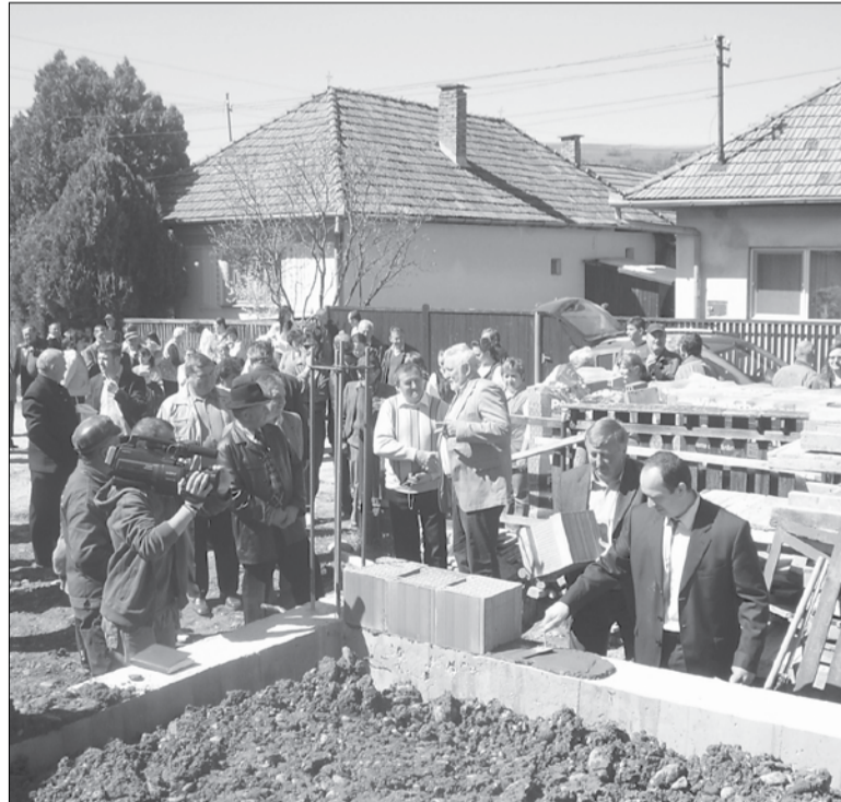
Alapkőletétel Keményfalván. Kultúrház épül

A fenyédi templom kijáratánál egy nagy és biztonságos parkolót is kialakítottak húsz-huszonöt autó számára, hogy a temetések, esküvők, szentmisék résztvevőinek ne a forgalmas megyei úton kelljen parkolniuk. Maga a templom épülete