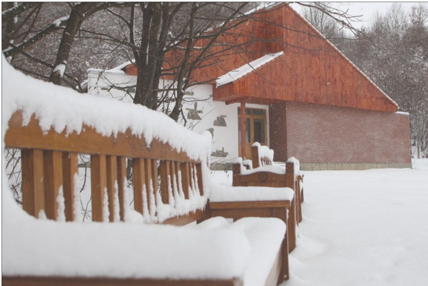
Csendélet a Szejkén. Tavasszal gépektől lesz hangos

Most már csak sós víz vagy gáz kellene, hogy újból régi pompájában csilloghasson az egykori fürdőtelep. ■ 4. oldal