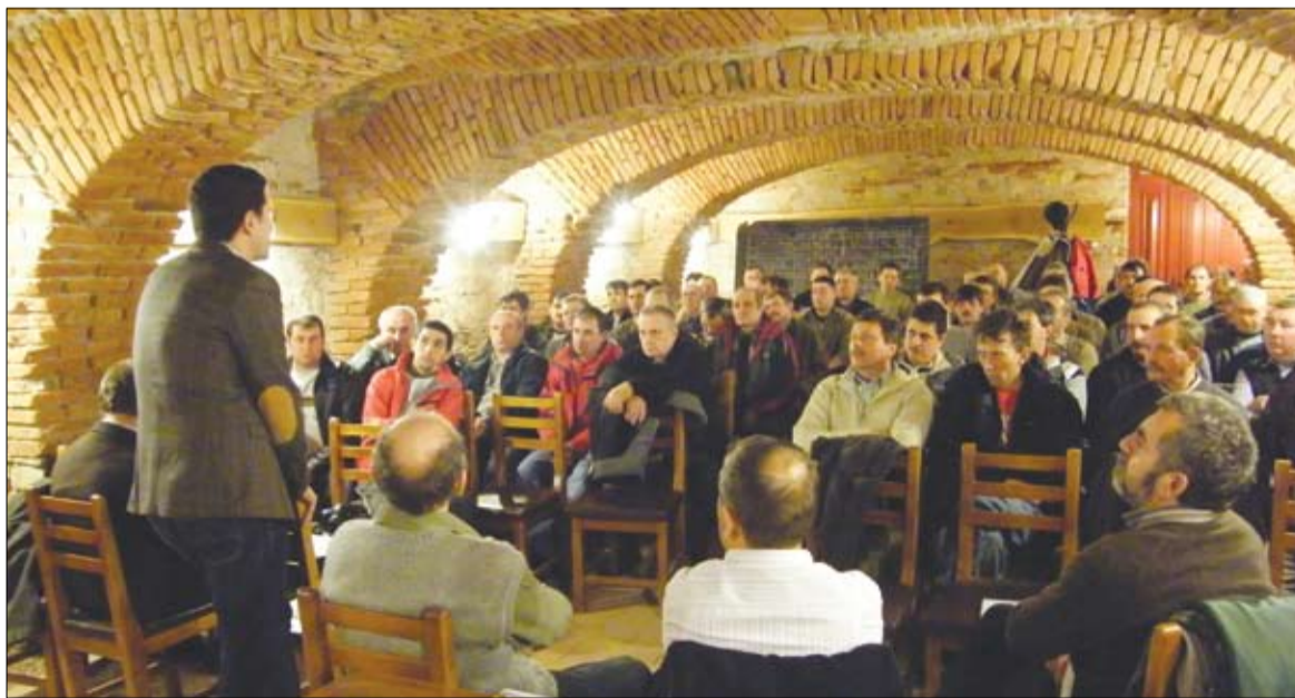
Jelentős érdeklődés övezte a gazdafórumot. Fontos újdonságok terítéken

Az államtitkár újdonságként jelentette be, hogy a kedvezőtlen adottságú hegyvidéki tehéntartóknak szóló támogatás mintájára utolsó száz méterére fordult a hússzarvasmarhák támogatási rendszerének kivitelezése is, miután a szaktárca a támogatási programot immár a brüsszeli szakhatóság számára is elküldte jóváhagyásra. Tanczos szerint amennyiben az Európai Bizottság szakemberei az új támogatási programot a napokban kedvezően véleményezik, az erről szóló kormányrendelet akár már február során megjelenhet. A farmonként legtöbb 90 darab hússzarvasmarha támogatását lehetővé tevő program kapcsán Tanczos leszögezte: e révén is a gazdákat akarják támogatni, nem a növen-