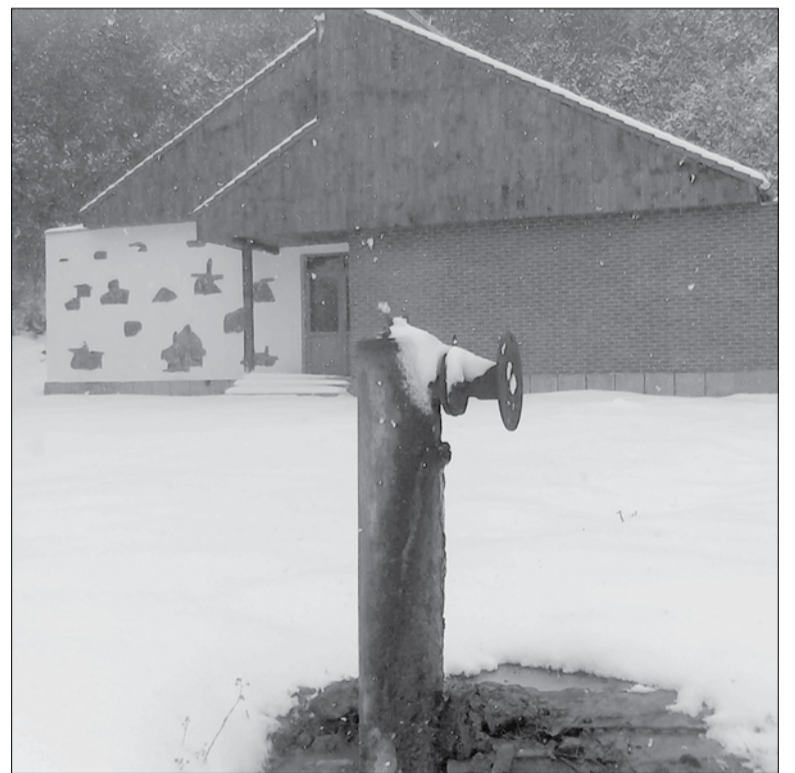
A megszállt mofetta. Már csak gáz kellene