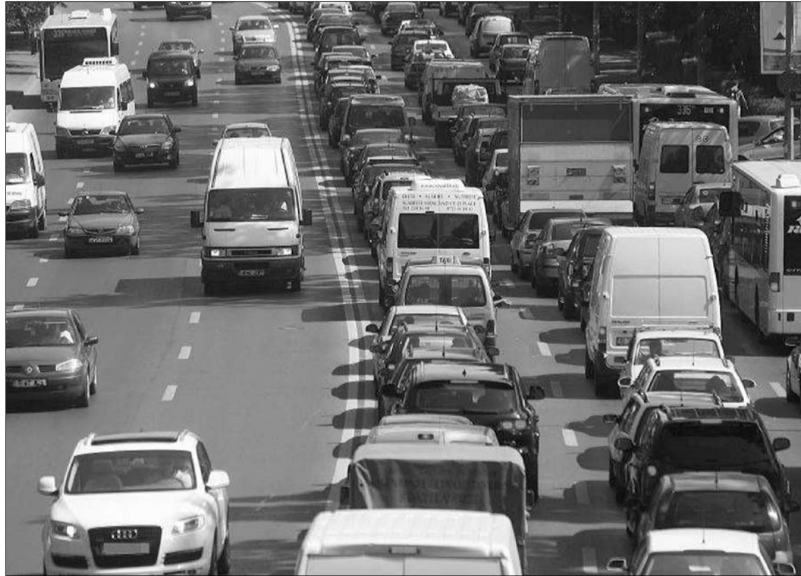
Az új illetékszint 25%-ig terjedően kisebb, mint az eddigi, de ez nem jelent minden gépkocsi esetében ilyen arányú megtakarítást.

A Romániában első ízben beíratásra kerülő gépkocsik esetében az illetékszintet ugyancsak a területileg illetékes adóhatóság állapítja meg, arra vonatkozóan szabványkérést kell benyújtania az érintett tulajdonosnak, amely modelljét a 2003/28-as rendelet melléklete tartalmazza. Ameny-