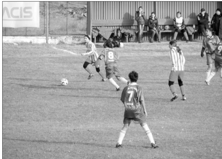
Tavasztól Nagygalfalván játszanak a szentegyházi lányok

A lányok már hétvégén egy barátságos teremtornára hivatalosak Sepsiszentgyörgyre, ahol hat csapat fogja összemérni tudását. A Vasas mint címvédő fog a háromszéki városba utazni. A további felkészülési programban öt barátságos találkozó szerepel a Marosvásárhelyi FCM és a Szászrégeni Egyesülés női csapatai ellen, továbbá a Székelyudvarhelyi ISK U15-ös és a Székelykeresztúri Egyesülés U16-os fiúcsapatai ellen. Az ötödik barátságos mérkőzésre még keresik az ellenfelet. Az előbbi csapatokkal még nem szögezték le időpontot, ugyanis az nagyban fog függeni az időjárástól is. A téli szünet alatt, február 6–12. között egy edzőtábor