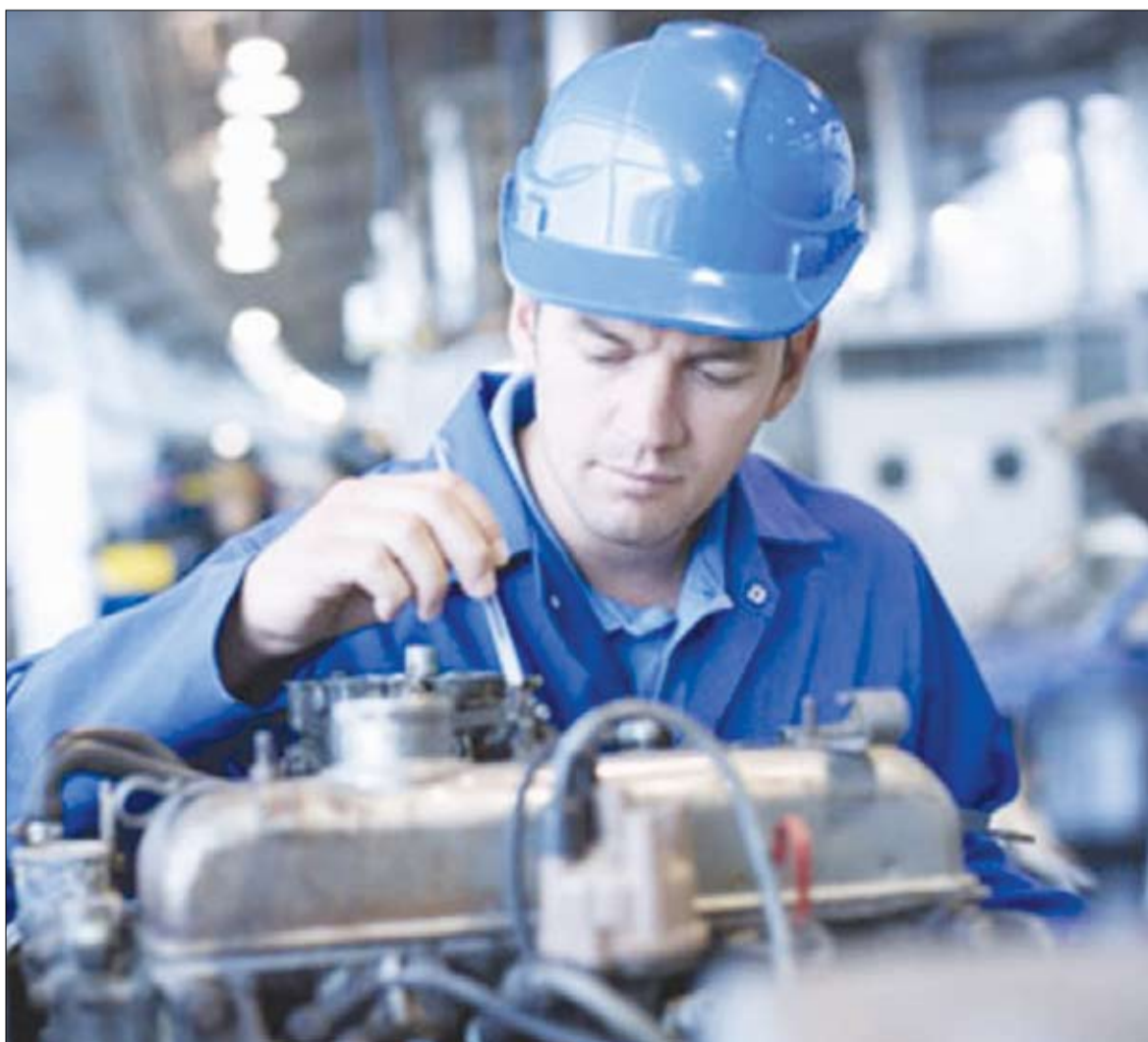
Statistikában vagy azon kívül, a Romániából kivándorolt munkavállalókat világszerte foglalkoztatják

Nincs olyan lakosa Romániának, aki kapásból ne tudna felsorolni néhány (sok esetben akár tucatnyi, vagy még több) olyan ismerőst, aki külföldön keresi a boldogulását – például egy csíkszeredai lány Omanban bébiszitterkedik. A huzamosabb ideig külföldön tartózkodó romániai állampolgárok számára vonatkozóan nemigen áll rendelkezésre hiteles és megbízható adat. Az biztos, hogy számuk nem kevés, mint ahogy az is: túlnyomó többségük (jobb megélhetési, illetve munkavállalási szándékkal hagyta el lakhelyét, családját. Immár több mint húsz éve érződik ez a tendencia, mikor erőteljesebben, mikor mérsékeltebben.