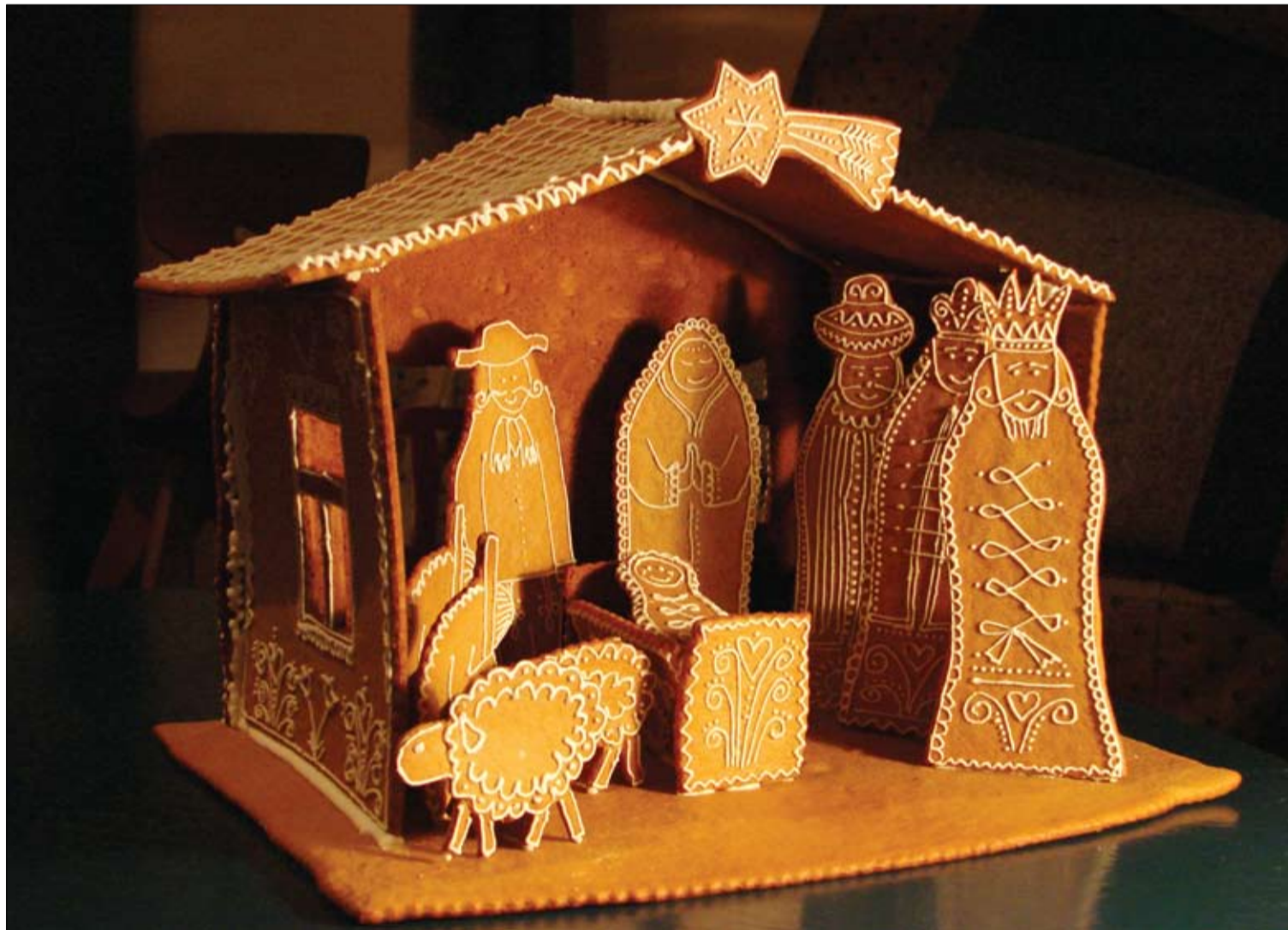
Mézeskalácsból készült betlehemi jászol. A szereteteinkkel közösen töltött idő lehet az egyik legszebb karácsonyi ajándék

Van, aki készen vásárolja, más saját öröme, kisgyermekes házban közös programként vagy éppen ajándékba süti barátai, ismerősei számára – néha már-már művészi szintre fejlesztve a technikáját. A mézeskalács jellegzetes íze és illata egybefonódik a karácsonnyal. 3. oldal