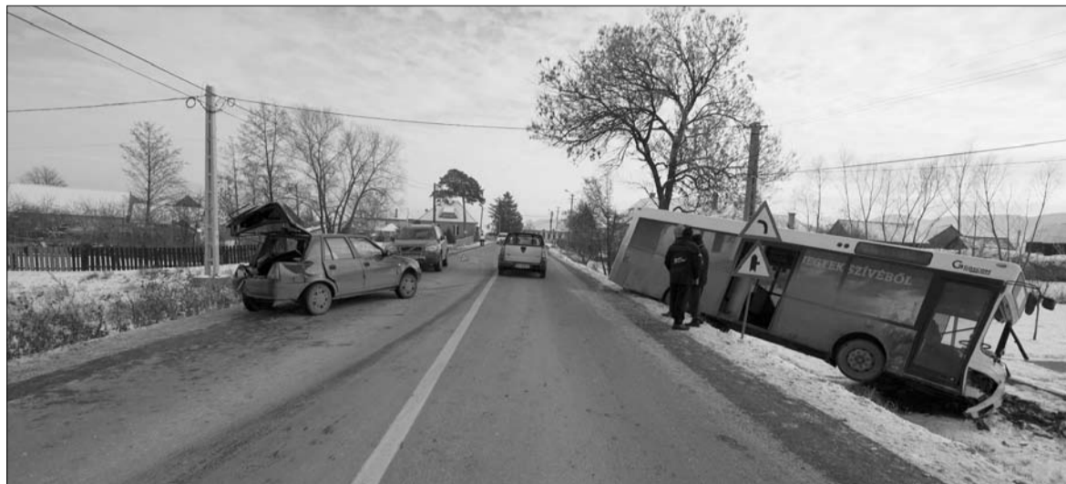
Árokba fordult a városi autóbusz. A baleset következtében két gyermeknek kórházi ápolásra volt szüksége, de állapotuk nem súlyos