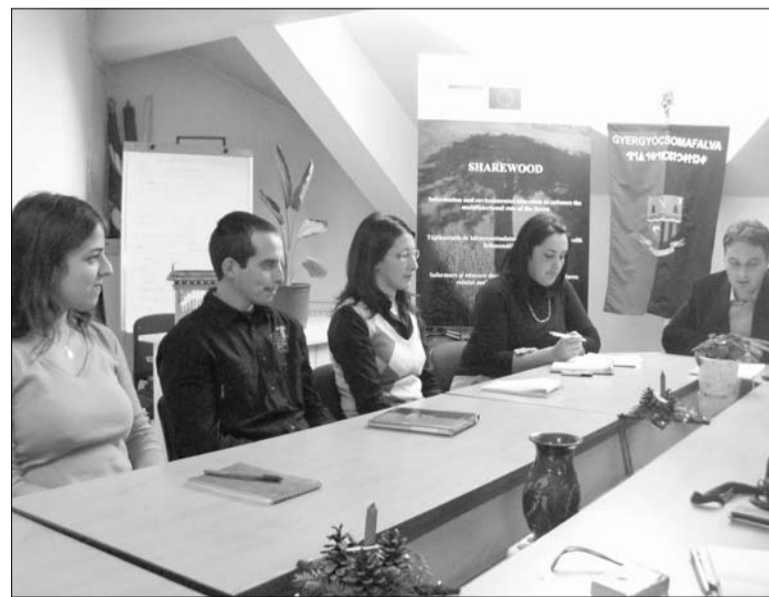
Tájékoztatót a Robinwood csapata. Csomafalván fiatalok kezében az erdő jövője

mint eddig, akkor már megérte, hogy itt most énekelnek, verseket mondanak – magyarázta látogatásuk célját Nagy Katalin tanár. A diákok egyébként nemcsak ünnepi műsorral kedveskedtek az öregotthon lakóinak, hanem gyümölcsöt is vittek ajándékba. Verses-zenés összeállításukat a Szent István-templomban is bemutatták, ez alkalommal adományokat gyűjtöttek rászoruló iskolatársaik meleg ebédjére.