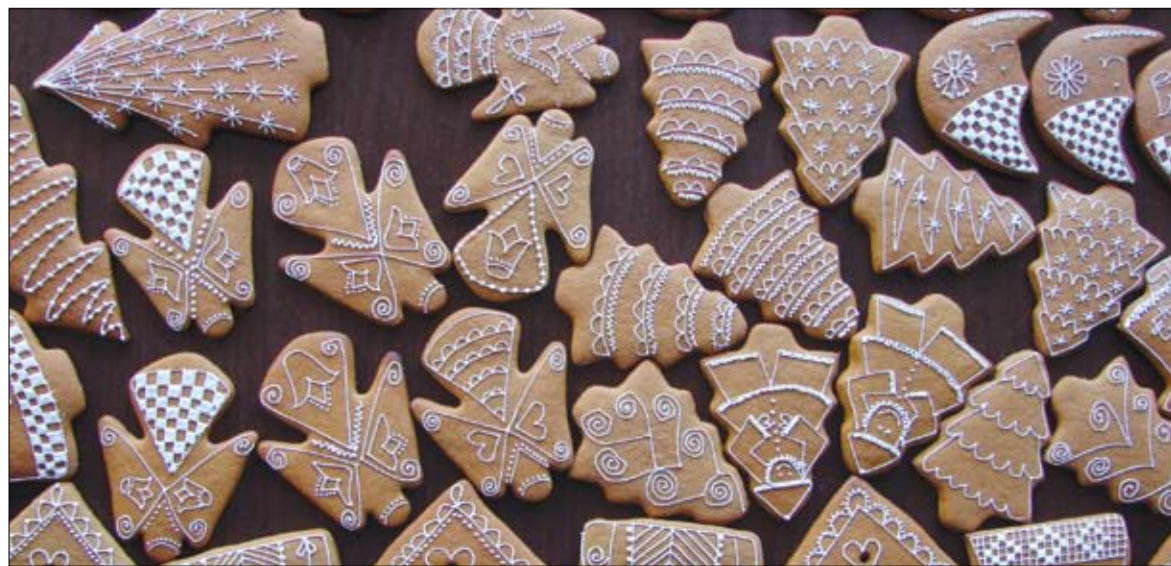
Mézeskalács-figurák. Alkotói fantázia