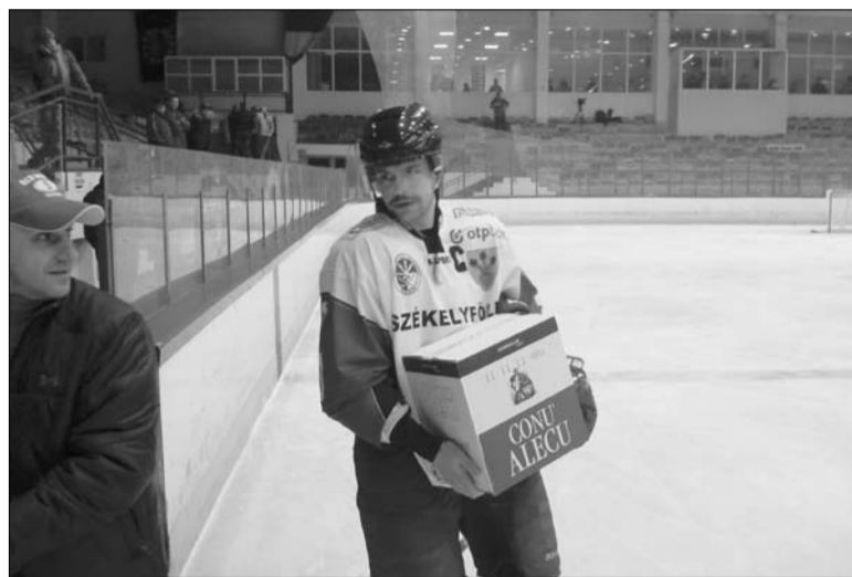
Egy doboz bor a harmadik helyért