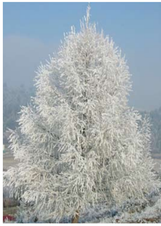
Ezüstfenyő (CSÍKSZENTKIRÁLY)

Névvel ellátott fényképeiket és a javasolt képaláírást a benedek.eniko@hargitanep.ro e-mail címre vagy szerkesztőségünk postai címére (530190 Csíkszereda, Szentlélek utca 45. szám) várjuk.