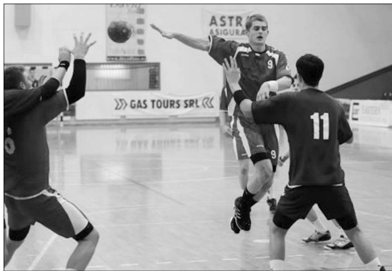
Eddig jól állja a sarat az ISK-SZKC ifjúsági I-es csapata

A Székelyudvarhelyi SZKC vezetősége és játékosai ezúton kívánják kellemes karácsonyi ünnepeket és Boldog új esztendőt.