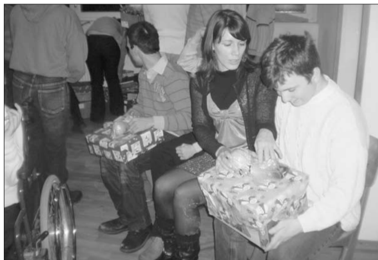
Közös ünnepen. A nehézségek ellenére mindenkinek jutott ajándék

Csata Kinga beszédében azonban arra is kitért, hogy az intézmény