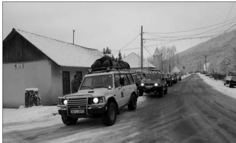
Ajándékot hozó terepjárósok

– Ezek a települések, mint Üknyéd, Pálpataka, Fenyőkút, Var-