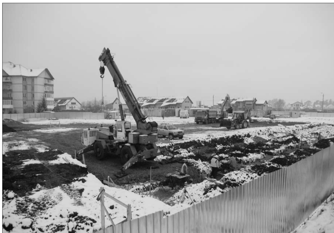
Tereprendezési fázisban tart a csíkszeredai áruházépítés. A Lidl negyedik Hargita megyei üzletét májusban adjhatják át

Ebbe a keretbe helyezhető az idén átadott több mint 20 új nagyáruház révén a Lidl Románia – az ország valamennyi megyéjét lefedő – látványos terjeszkedése is. Legutóbb Iași-ban adtak át új áruházat, Csíkszeredában pedig – öt másik helyszínnel együtt – immár gőzerővel zajlanak az építkezési munkálatok. A megyeszékhelyünkön épülő – Hargita megye szintjén egyébként immár negyedik – Lidl áruház avatójára a jövő év májusában kerülhet sor. Bár – mint lapunk megtudta – a ki-