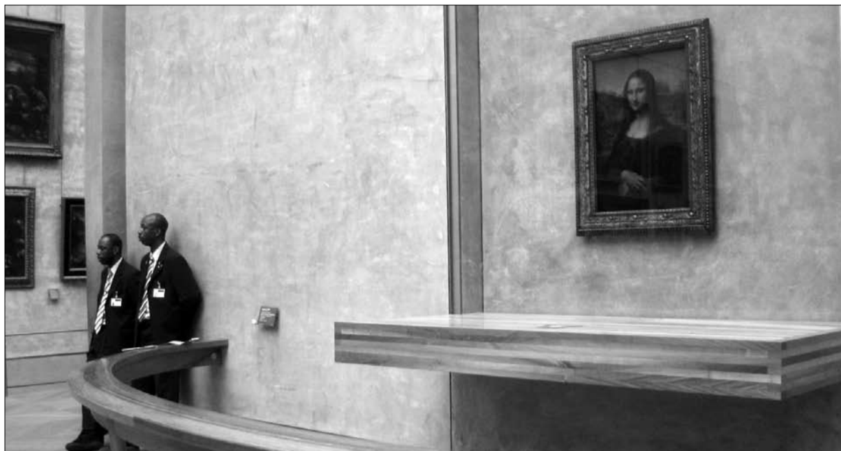
Da Vinci híres portréjának mását őrző biztonságiak. Nem bízzák a véletlenre

Gyerekként volt a világ egyik leg-híresebb festményének elrablása: nem kellett hozzá más, csak egy fehér köpeny, amelyet az alkotókat másoló hobbifestők viselnek. Vincenzo Peruggia száz éve, 1911. augusztus 21-én sétált ki a Louvre-ból, hóna alatt a Mona Lisával, Leonardo da Vinci híres mosolyú női portréjával.