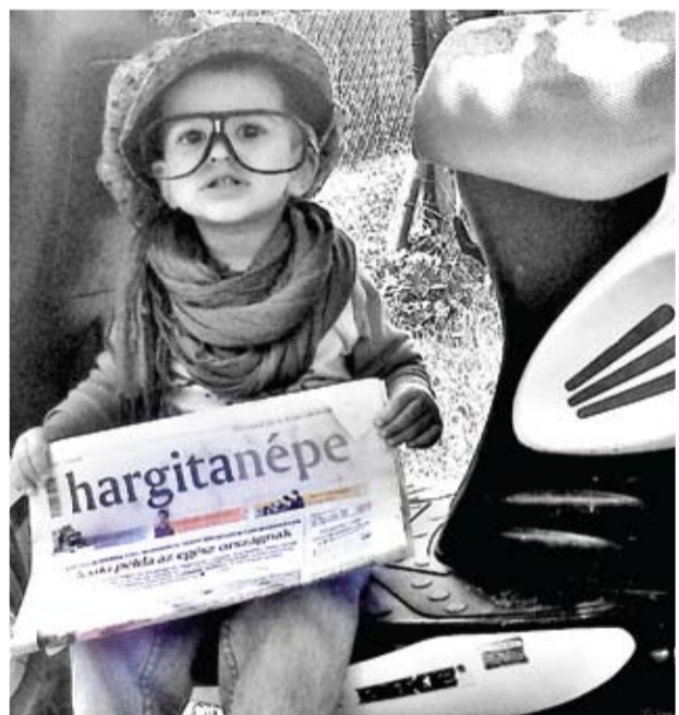
Te olvastad már, hogy...?