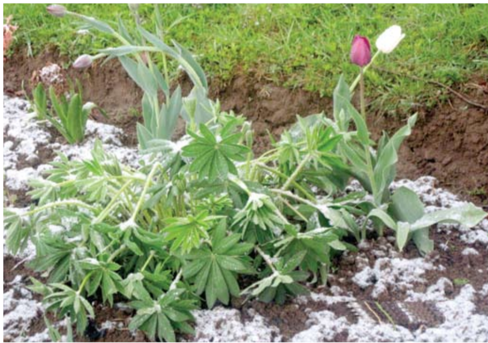
Havas tulipán. Nem mindennapi a mostani időjárás...